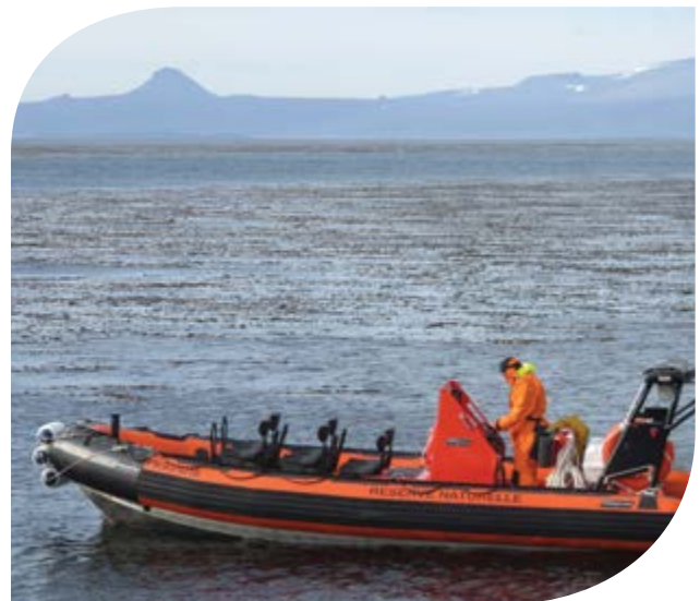
La campagne 2015 n'a pu être réalisée que grâce au support du semi-rigide le Commerçon et à son équipage composé d'agents de la réserve.

Depuis l'arrêt du navire la Curieuse , le programme de suivi doit s'adapter à des moyens nautiques plus restreints. L'installation des stations de l'observatoire fournit maintenant les moyens de suivi à long terme et de surveillance de l'impact des changements environnementaux. Si les quatre sites du Golfe du Morbihan sont bien accessibles grâce au Commerçon , le suivi des quatre sites extérieurs ne peut plus être assuré de façon pérenne. Cette année, le suivi d'une station du nord, Port Christmas, a pu être réalisé à l'occasion du passage du Marion Dufresne à proximité à OPO3. Les plongeurs ont pu intervenir depuis l'annexe du navire avec succès. Par contre, le caractère très opportuniste de ce type d'opération n'a pas permis le suivi de l'autre station du nord, Port Couvreur, malgré le passage du navire à proximité. Des solutions complémentaires seront recherchées dès l'an prochain par la réserve afin d'assurer un suivi régulier des sites.