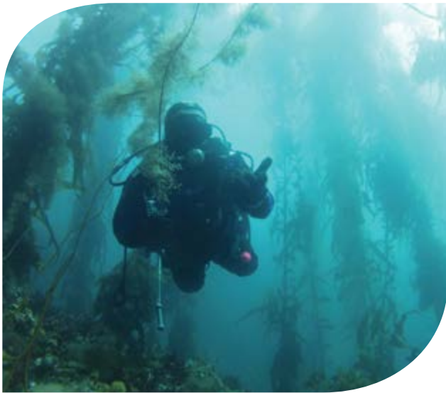
Les frondes de l'algue Macrocystis pyrifera peuvent atteindre 50 m de longueur et constituent de denses couverts végétaux. De nombreux organismes marins dépendent de ces habitats pour vivre.