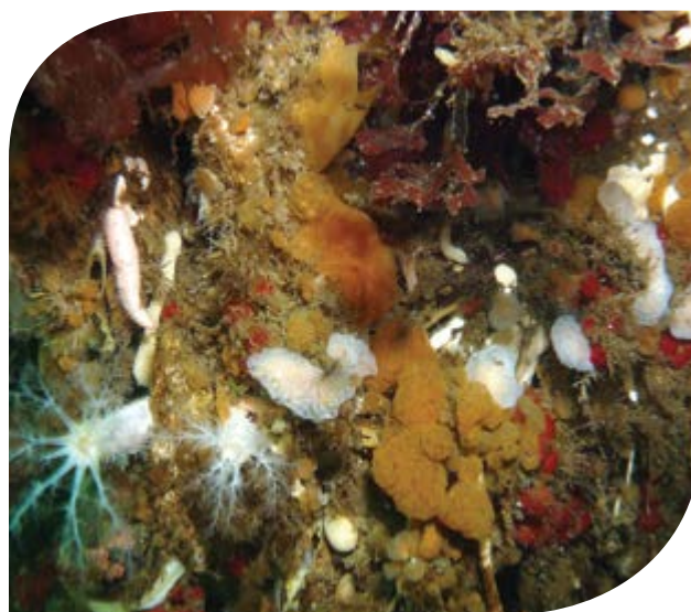
Les fonds rocheux sont couverts d'une faune benthique riche et diversifiée dont l'inventaire est en cours de réalisation. Ile Haute, 15 m.

Le suivi à long terme inclut: 1) la relève et le renouvellement de thermo-enregistreurs et de placettes de colonisation, 2) la conservation et le conditionnement de ces placettes, 3) l'acquisition et le traitement des données de température sur ordinateur et 4) la réalisation de prises de vue sous-marines. Ce partenariat devrait être encore davantage développé dans le second plan de gestion.