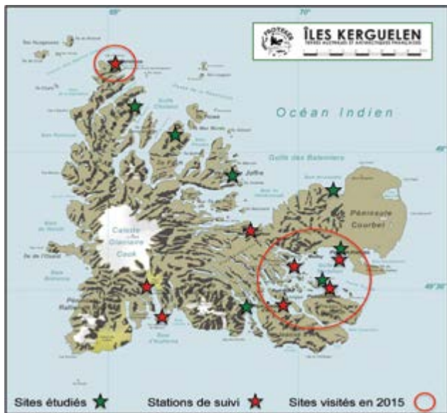
Localisation des sites de l'observatoire. Les sites cerclés de rouge sont ceux visités lors de la campagne 2015.

Comme dans toutes les mers chaudes et tempérées, les écosystèmes côtiers des régions subantarctiques concentrent une importante biodiversité. Relativement peu impactés par les activités anthropiques, du moins de façon directe, ils sont confrontés à des changements environnementaux dont les effets sont encore mal cernés (évolution des températures, modification des courants marins, glissements saisonniers, migration d'espèces...). En particulier, les écosystèmes marins côtiers des îles subantarctiques françaises ont été relativement peu étudiés et leur biodiversité est dès lors encore peu connue comparée à celle des domaines marin pélagique et terrestre. Fort de ce constat, le programme PROTEKER ( http://www.proteker.net/?lang=en ) (n°1044 de l'IPEV) a vu le jour en 2011 avec pour objectif la mise en place d'un observatoire marin pour le suivi écologique de la biodiversité marine côtière des Îles Kerguelen et l'évaluation des effets des changements environnementaux sur cette biodiversité. Il consiste en une approche pluridisciplinaire: mesures océanographiques, cartographie benthique, analyses génétiques, éco-physiologiques, isotopiques et écologiques. Outre l'inventaire et le suivi écologique de la biodiversité, il a aussi pour ambition de fournir des critères scientifiques aux gestionnaires en charge des politiques de conservation.